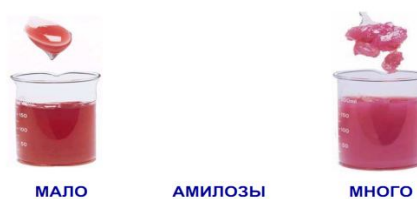
Рисунок 1 – Влияние амилозы на гелеобразование

Картофельный крахмал отличается тем, что образует вязкие, прозрачные клейстеры, нестабильные при хранении, перемешивании и термическом воздействии. В картофельном крахмале содержится много амилозы, в связи с этим в готовом продукте влага плохо удерживается и при хранении выделяется, что приводит к скорой порче продукта. Влияние амилозы на гелеобразование показано на рисунке 1.